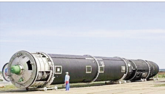
Rusiyanın ən yeni ballistik raketini olan "Sarmat"ın prototipi istehsal edilib. SİTA informasiya agentliyinin yaydığı xəbərə görə bildirilir ki, Krasnoyarsk məşinçayırma zavodunda istehsal edilən raketin uçuş-konstruktor sınaqlarının 2016-cı ilin yaz-yaş aylarında Plesetsk kosmodromunda keçirilməsi planlaşdırılır. Raketin işsahmə qurğusunun quraşdırılması üzrə işlər 2016-cı ilin mart ayında başa çatdırılmışdır.

Qeyd edək ki, "Sarmat" strateji raket kompleksini 15A18M ağır raketləri ilə təchiz olunan sovet istehsalı "Voyevoda" R-36M2 komplekslərini əvəz edəcək. Yeni raket 4 tona yaxın nüvə başlığını 10 min km-ə qədər məsafəyə daşıya biləcək. "Sarmat"ın tək ballistik trayektoriyaya üzrə deyil, eyni zamanda atmosferin uxarıqlarında da hərəkət etmək imkanına malik olacağı bildirilir.