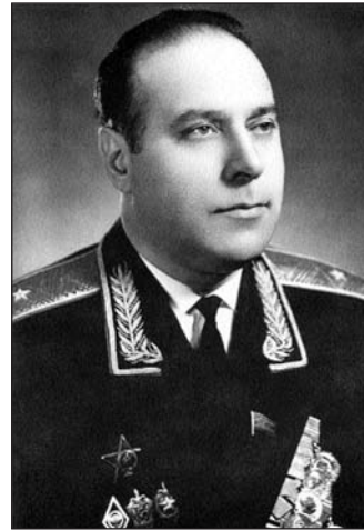
Dövlət təhlükəsizliyi orqanlarında keçdiyi həyat məktəbi: Leytenantdan... DTK general-mayoruna qədər